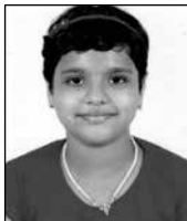
ഗിഫ്റ്റി മറിയം മിനു സെന്റ് മേരീസ് പ്രകാശഗിരി ലളിതഗാനം ഭദ്രാസന 2nd പ്രസംഗം സോണൽ & ഭദ്രാസനം 1st